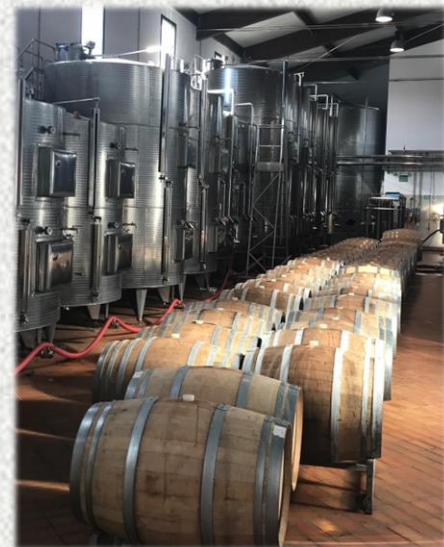
(어터너티바0.0 탈-알코올 시설)

Tip 트렌티노-알토 아디제(Trentino-Alto Adige)지역은 이탈리아의 가장 북쪽에 위치해 있으며, 오스트리아와 국경을 맞대고 있습니다. 이곳에서는 이탈리아에서 가장 매력적이고 믿을 만한 와인산지로 알려져 있으며, 와인의 품질을 향상시키고 판매를 촉진하고 품질의 표준을 정하는데 가장 노력한 지역입니다.