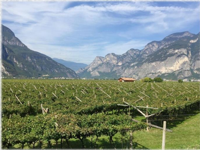
(어터너티바0.0 알토 아디제 포도밭 1)