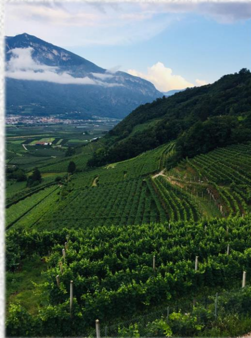
(어터너티바0.0 알토 아디제 포도밭 2)